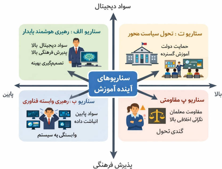
شکل ۱. فهم رهبری آموزشی در عصرهوش مصنوعی: سناریوهای آینده آموزشی.